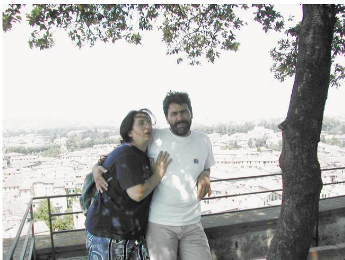
Deux amoureux sur une des tours de San Lucca

PP, VO, JJ, FB, Jeff visiterons ST Lucca, montée à la tour de 40m,