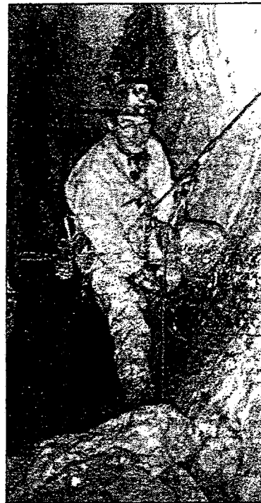
La spéléo : un sport « solitaire et solidaire »